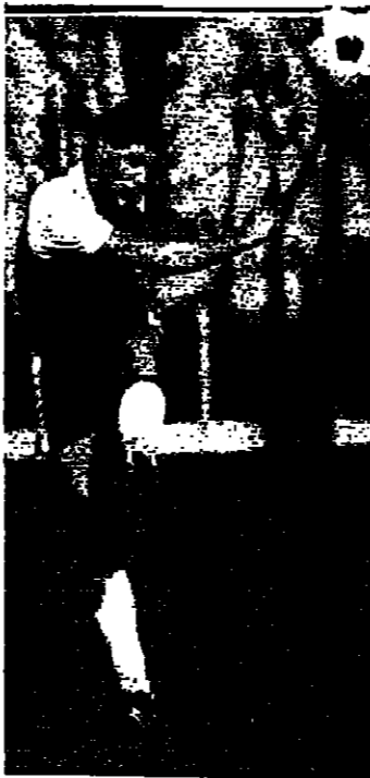
شريف اودجاني يتألق بدوري فرنسا لكن طموحاته مرتبطة بالمنتخب الجزائري